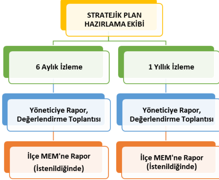
Şekil 2. İzleme ve Değerlendirme Süreci